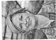
Silvia Fregolent Senatrice di Italia Viva è capogruppo in commissione Ambiente.

Lo dichiara la senatrice di Italia Viva Silvia Fregolent, capogruppo in commissione ambiente: «Gli investimenti in sicurezza permettono alla